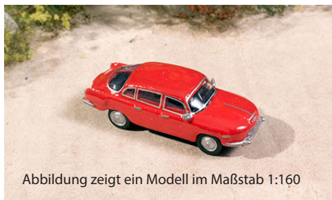
Abbildung zeigt ein Modell im Maßstab 1:160

Das folgende Bild zeigt ein Beispiel eines fertigen Modells im Maßstab 1:160: