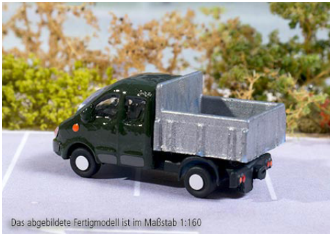
Das abgebildete Fertigmodell ist im Maßstab 1:160

Viel Spaß in den kommenden Bastelstunden mit Ihrer ganz individuellen Version dieses detaillierten etchIT -Modells!